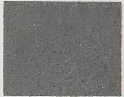
TOSCANA + DT #101 - 5 cc + DT #111 - 1 cc; DW TOSCANA