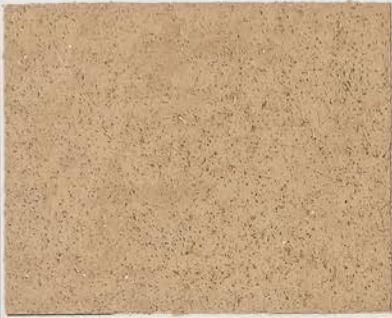
TOSCANA + DT №122 - 8 cc; DW TOSCANA