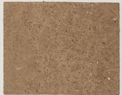
TOSCANA + DT #120 - 8 cc + TT #501 - 4 cc; DW TOSCANA