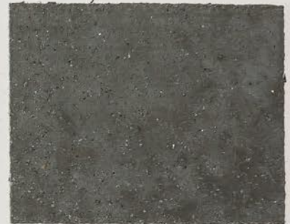
TOSCANA + DT №101 - 10 cc + DT №103 - 1 cc; DW TOSCANA