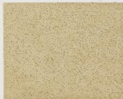
TOSCANA + DT №102 - 2 cc + DT №121 - 1 cc; DW TOSCANA