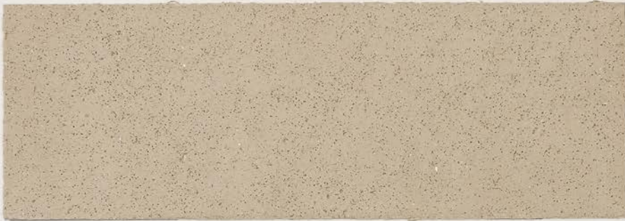
TOSCANA + DT #123 - 3 cc; DW TOSCANA