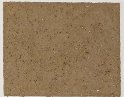
TOSCANA + DT №122 - 8 cc + DT №124 - 8 cc; DW TOSCANA