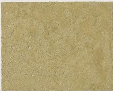
TOSCANA + DT #102 - 8 cc; DW TOSCANA