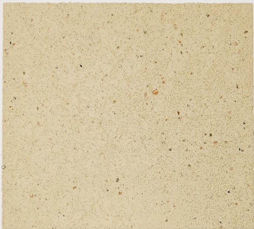
TOSCANA + DT №102 - 1 cc + DT №121 - 1 cc + DECOR FLAKES Bronze; DW TOSCANA