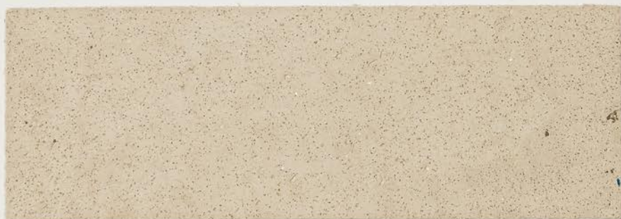
TOSCANA + DT №120 - 1 cc + DT №124 - 1 cc; DW TOSCANA