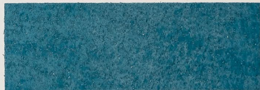
TOSCANA + DT №109 - 20 cc + TT №501 - 10 cc; DW TOSCANA