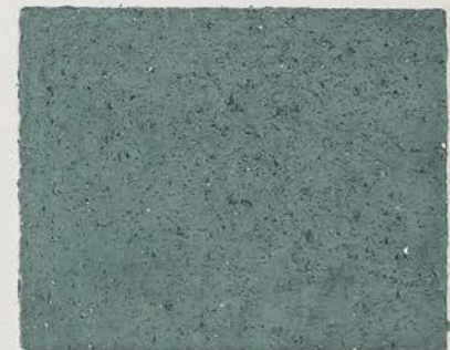
TOSCANA + DT №124 - 5 cc + TT №505 - 5 cc; DW TOSCANA