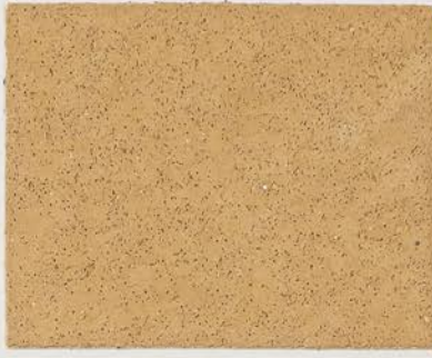
TOSCANA + DT #103 - 10 cc; DW TOSCANA