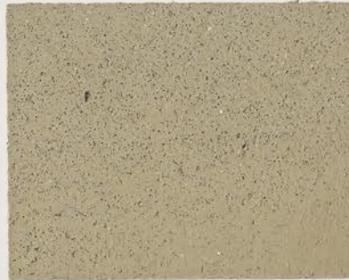
TOSCANA + DT №124 - 6 cc; DW TOSCANA