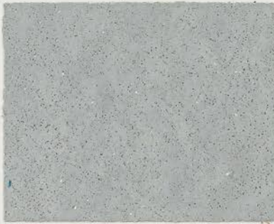
TOSCANA + DT #104 - 2 cc + DT #109 - 1 cc; DW TOSCANA