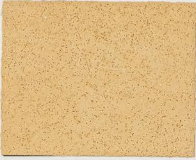
TOSCANA + DT #121 - 5 cc; DW TOSCANA