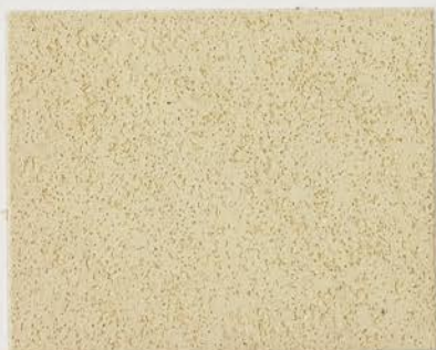
TOSCANA + DT №142 - 1 cc + DT №102 - 1 cc; DW TOSCANA