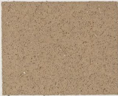
TOSCANA + DT №123 - 8 cc; DW TOSCANA