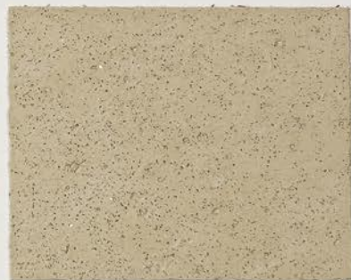
TOSCANA + DT №118 - 2 cc + TT №502 - 2 cc; DW TOSCANA