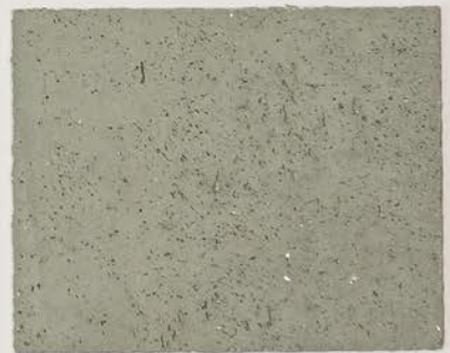
TOSCANA + DT #101 - 2 cc + DT #115 - 1 cc; DW TOSCANA